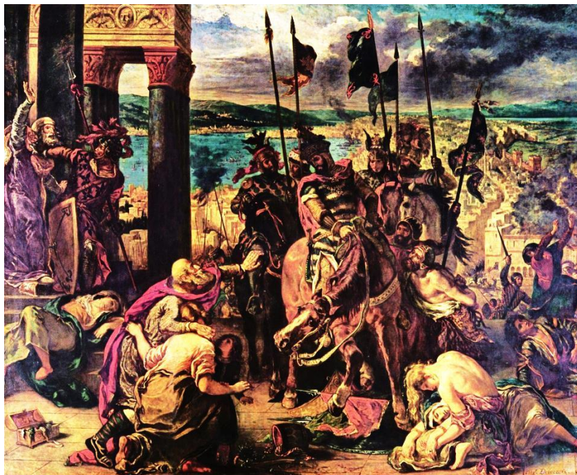
A keresztesek bevonulása Konstantinápolyba (E. Delacroix festménye)

„Úgy az ezredik esztendő táján Európa népessége növekedésnek indult, és ez a növekedési szakasz három évszázadig tartott. [...] A települések száma megsokszorozódott, új városok születtek, számos lakatlan hely benépesült. [...] E századok során [...] Európa lakossága megkétszereződött vagy megháromszorozódott.” (Massimo-Livi Bacci)