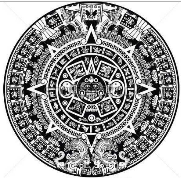
Azték naptár, a „Napok Köve”